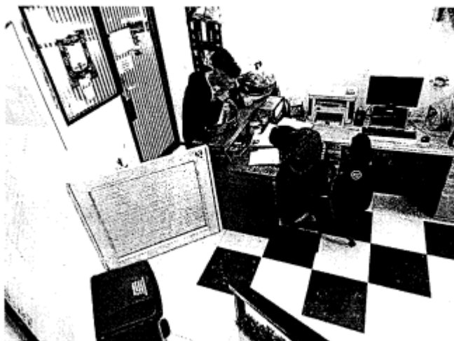
Fotografía 1. Procedimiento de verificación e incautación de un (1) Amazona amazonica (Lora alianaranjanda). Acta Única de Control al tráfico ilegal de flora y fauna silvestre No. 161855.